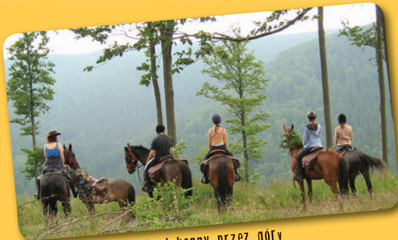
Rajd konny przez góry